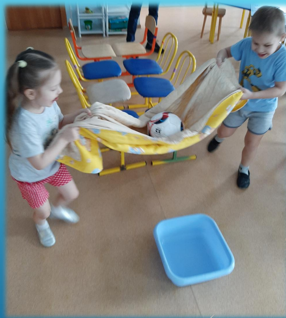
ИГРА «ВЕСЁЛЫЙ МЯЧ»