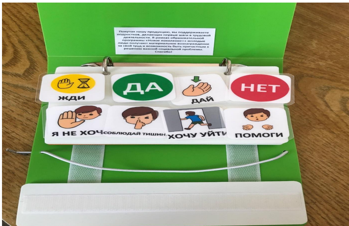
Индивидуальная книга ребенка с карточками PECS