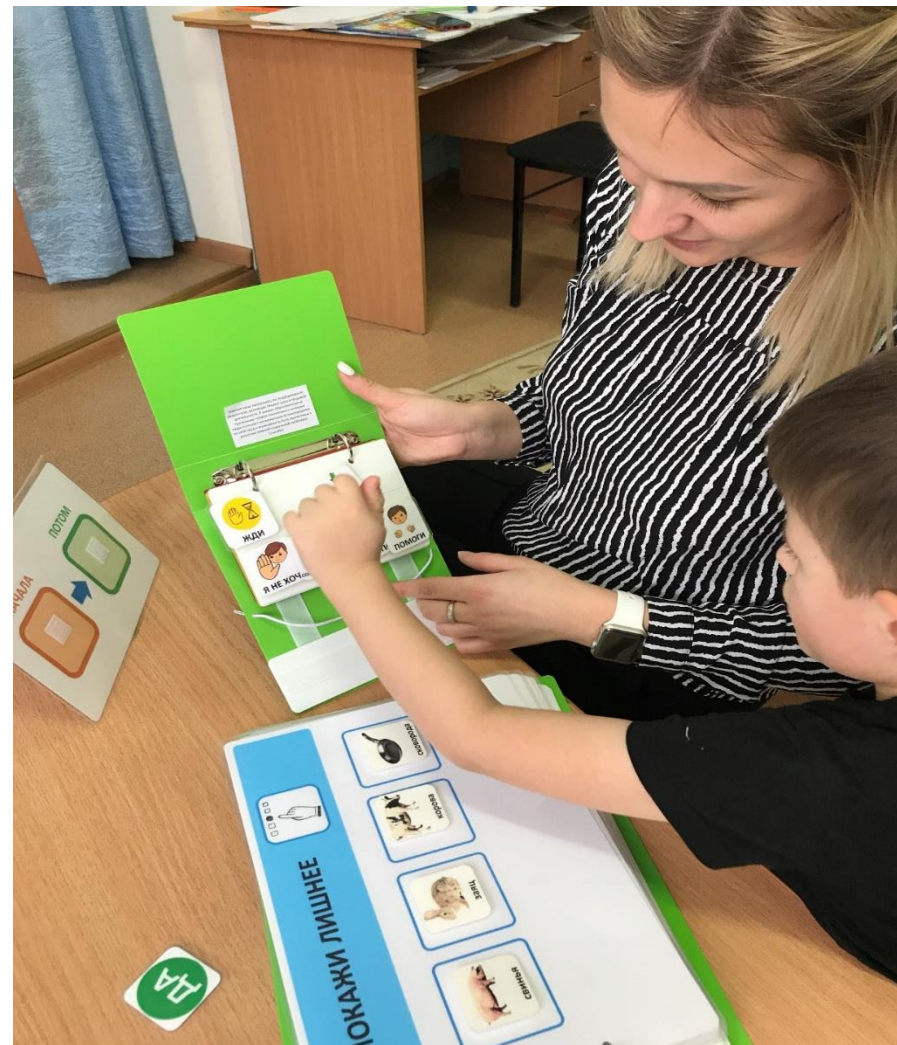
Занятие с логопедом по обучению альтернативной коммуникации с помощью карточек PECS