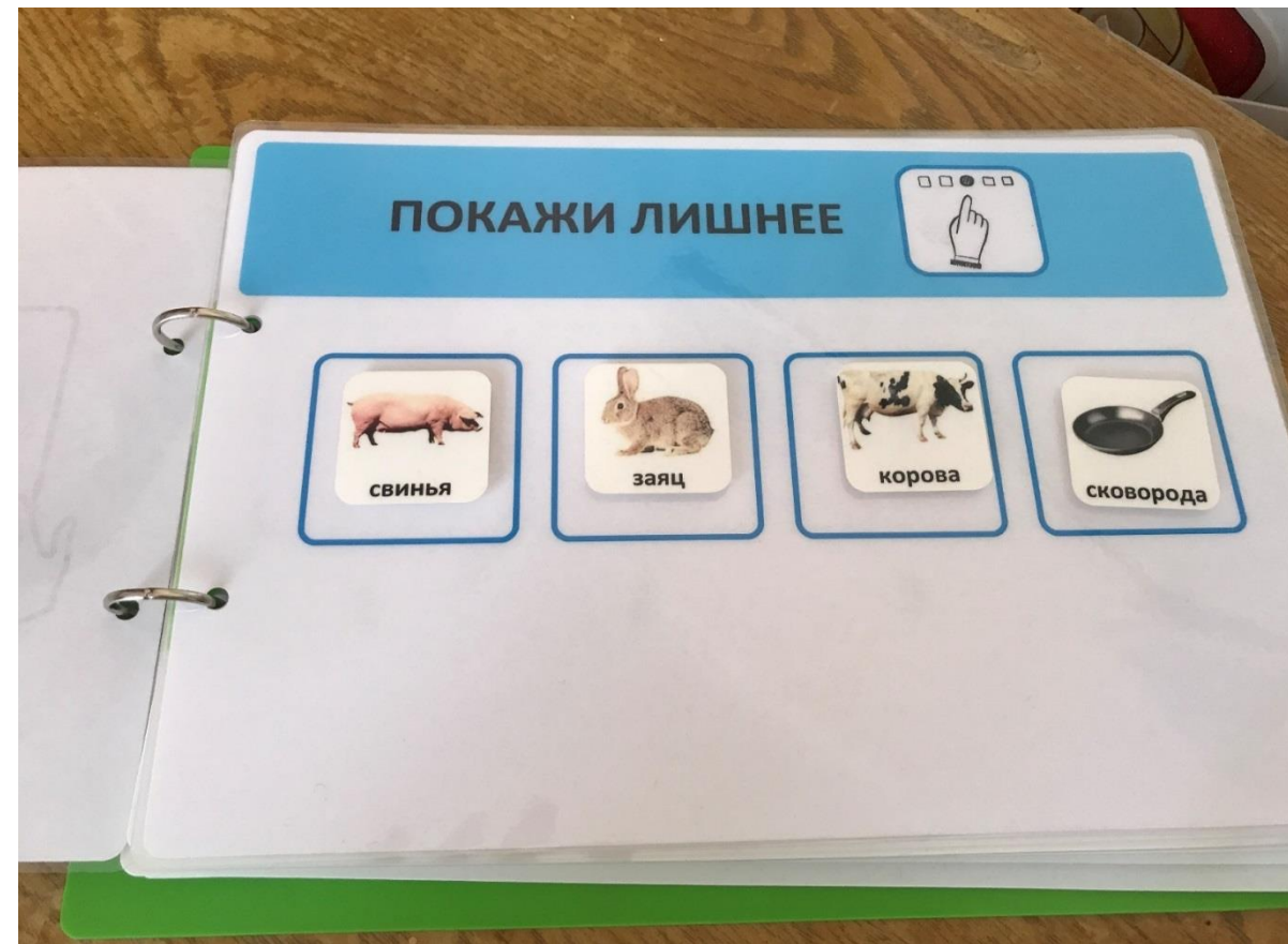
Диагностическое пособие для неговорящих детей