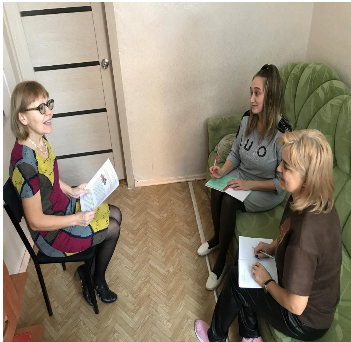
Встреча родителей с учителем-дефектологом