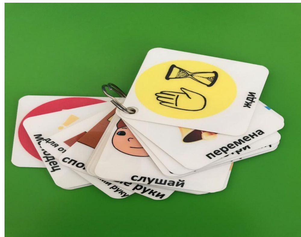
Набор карточек PECS для педагога