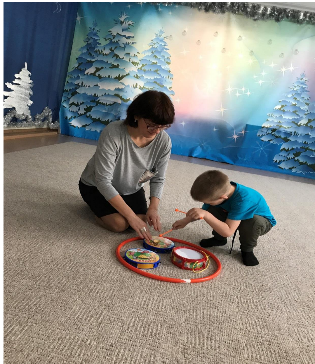
Занятие по сенсорной интеграции с музыкальным руководителем